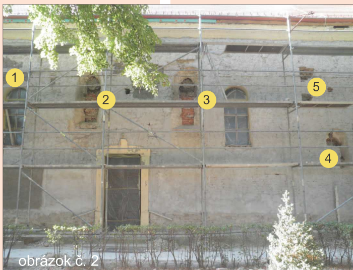
obrázok č. 2

Predbežne možno zistené poznatky zhrnúť nasledovne: Na mieste súčasného kostola stál starší románsky kostol, na výstavbu ktorého použili opracovaný a neopracovaný kameň. Tento kostol svojimi rozmermi narastajúcemu sa počtu obyvateľov Šintavy už nevyhovoval, preto ho zbúrali a postavili si nový väčší. Pri výstavbe využili kamenný materiál zo zbúraného kostola. Stalo sa tak niekedy okolo roku 1300, kedy doznieval románsky stavebný sloh a budovali sa už aj gotické stavby. Ešte v stredoveku nadstavali bývalú svätyňu do výšky lode (na dnešnú výšku) a na východnej strane postavili novú svätyňu. Neskôr na západnej strane pristavali