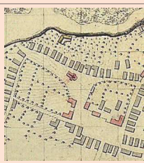
obrázok č. 1

vežu. Niekedy v období medzi druhou polovicou 18. storočia až začiatkom 19. storočia kostol radikálne prestavali. Zbúrali vežu, svätyňu, sakristiu a časť lode na západnej a čiastočne na východnej strane. Na západe postavili novú svätyňu so sakristiou a na východe novú do fasády vstavanú vežu. Vybúrali nové okná a staré popraskané stredoveké